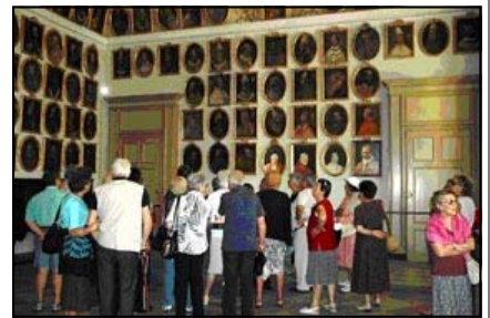
Visita alla Basilica di Superga