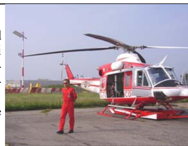
L'Augusta Bell 412

Un sentito grazie al Comune di Viù, alla locale Pro Loco ed ai colleghi dell'aeroporto e del Nucleo elicotteri per la disponibilità e la calorosa accoglienza riservatoci.