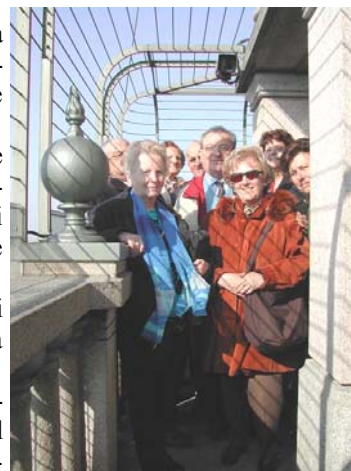
Sul terrazzo della Mole

Una bella esperienza, da proporre a chi non l'ha ancora vissuta, da ripetere per chi vi ha già partecipato.