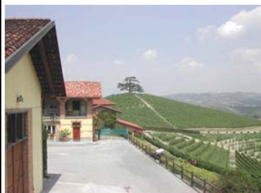
Vista dalla tenuta Montezzemolo, sullo sfondo, un cedro del Libano