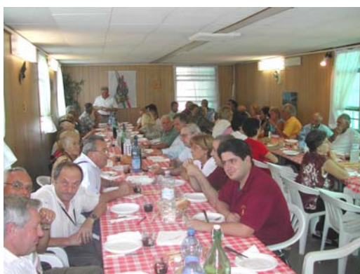
e alla fine...a tavola!